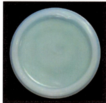
『なんこう練太郎』の軟膏

※ 調剤機の性質上、容器の上部が空いている場合がありますが処方箋に基づいていますのでご安心ください。