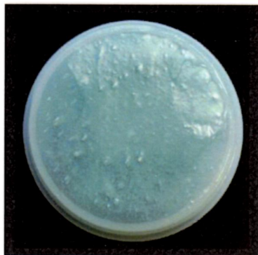
手練の軟膏(従来品)